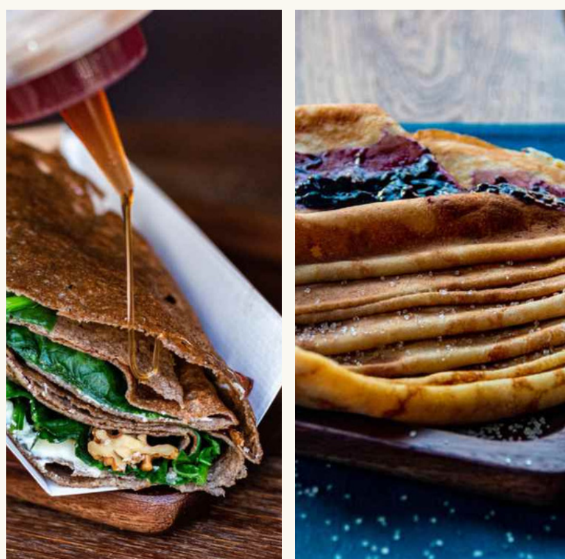
GALETTE SALÉE ET CRÊPE SUCRÉE